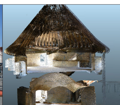
© L. Nuninger, M. Thivet, D. Vurpillot, Th. Chenal