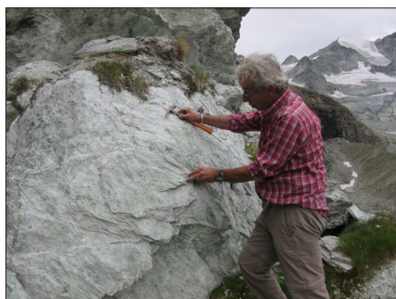
Gîte de néphrite en place à Grimentz (Valais, Suisse), glacier de Moiry